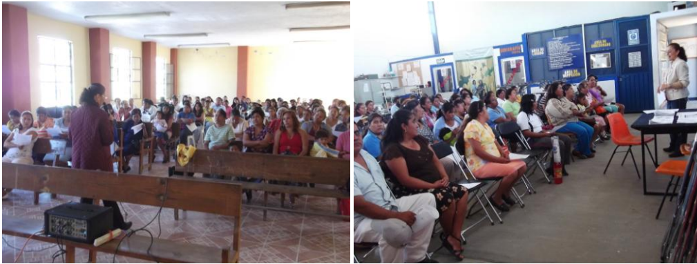
Taller Escuela para padres en los cinco planteles del CECyTE Morelos

29 docentes del CECyTE Morelos obtienen la certificación en Norma Técnica de Competencia Laboral en “Impartición de cursos de capacitación presenciales” a través del Consejo Nacional de Normalización y Certificación de Competencia Laboral (CONOCER).