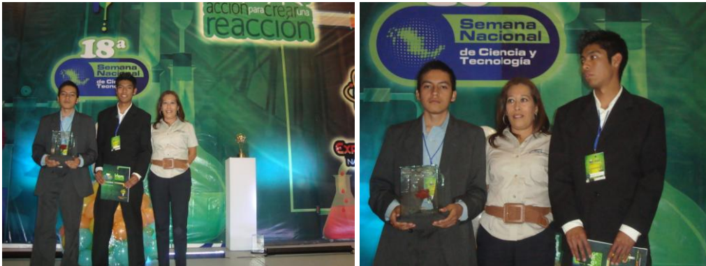
2do. Lugar Nacional en la Muestra de Cortometrajes 2011

El CECyTE Morelos participó en el “X Concurso Nacional de Creatividad Tecnológica y II de Docentes de los CECyTEs 2011”, con los prototipos “Conectat”, “Eduambiente”, “Control en tus manos”, “Mi Barquito” y “Tarjeta de Automatización Inteligente”; compitiendo con más de 25 Estados de la Republica. El evento se llevó a cabo del 06 al 10 de junio, en Tijuana, Baja California.