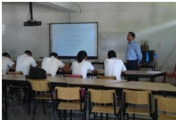
Certificación de 29 docentes del CECyTE Morelos

29 docentes del CECyTE Morelos obtienen la certificación en Norma Técnica de Competencia Laboral en “Impartición de cursos de capacitación presenciales” a través del Consejo Nacional de Normalización y Certificación de Competencia Laboral (CONOCER).