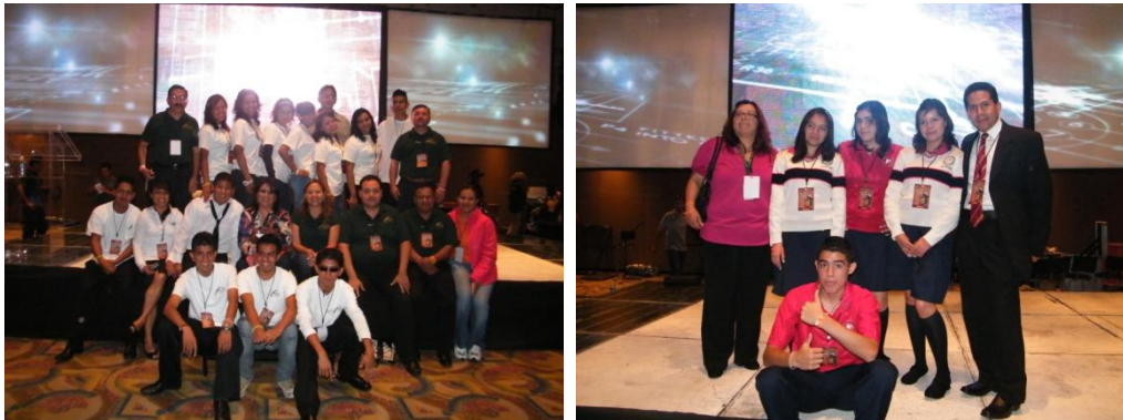
X Concurso Nacional de Creatividad Tecnológica de los CECyTEs 2011

El CECyTE Morelos participó en el “X Concurso Nacional de Creatividad Tecnológica y II de Docentes de los CECyTEs 2011”, con los prototipos “Conectat”, “Eduambiente”, “Control en tus manos”, “Mi Barquito” y “Tarjeta de Automatización Inteligente”; compitiendo con más de 25 Estados de la Republica. El evento se llevó a cabo del 06 al 10 de junio, en Tijuana, Baja California.